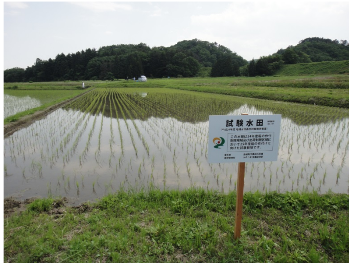
田植え Rice planting